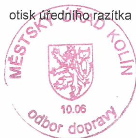
otisk úředního razítka